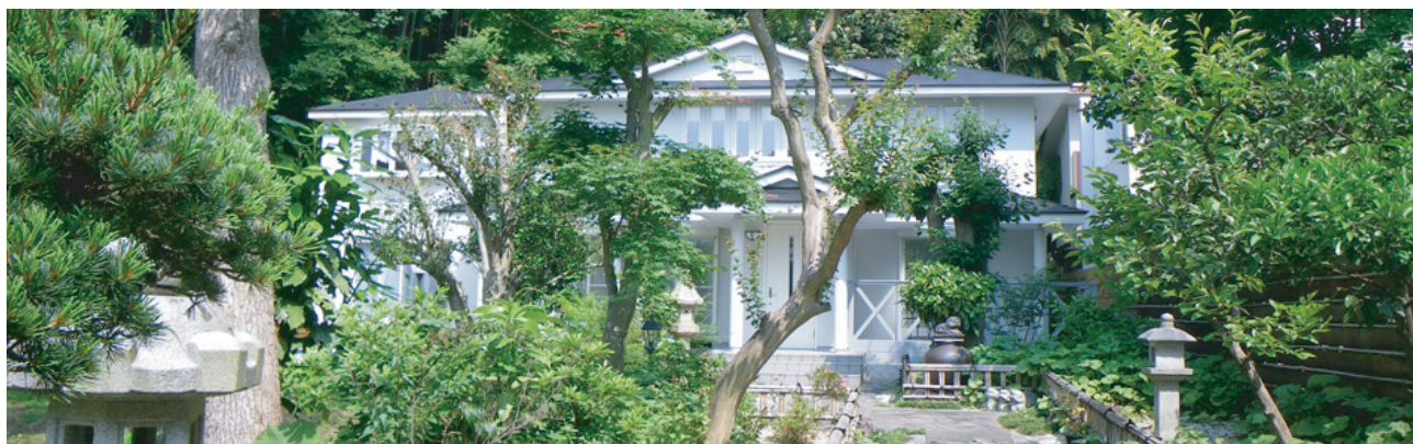
レインボーステイ 鎌倉の谷戸にある洋館カフェ&ヒーリングスペース